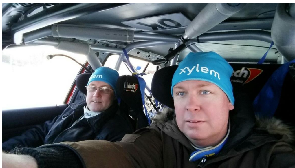
Den här selfien är nog tagen före SS4, lite sammanbitet kanske??